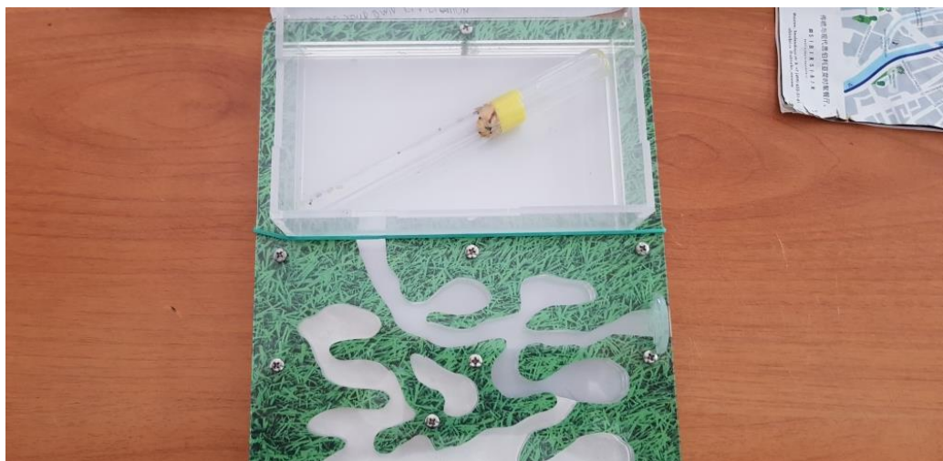
Фото 2 Установка пробирки-инкубатора в формикарий

II ОБЯЗАТЕЛЬНО Необходимо вставить заглушку (идущую в комплекте) ходов фермы глухую, либо открытую, если Вы соединяете данный формикарий с еще одним.