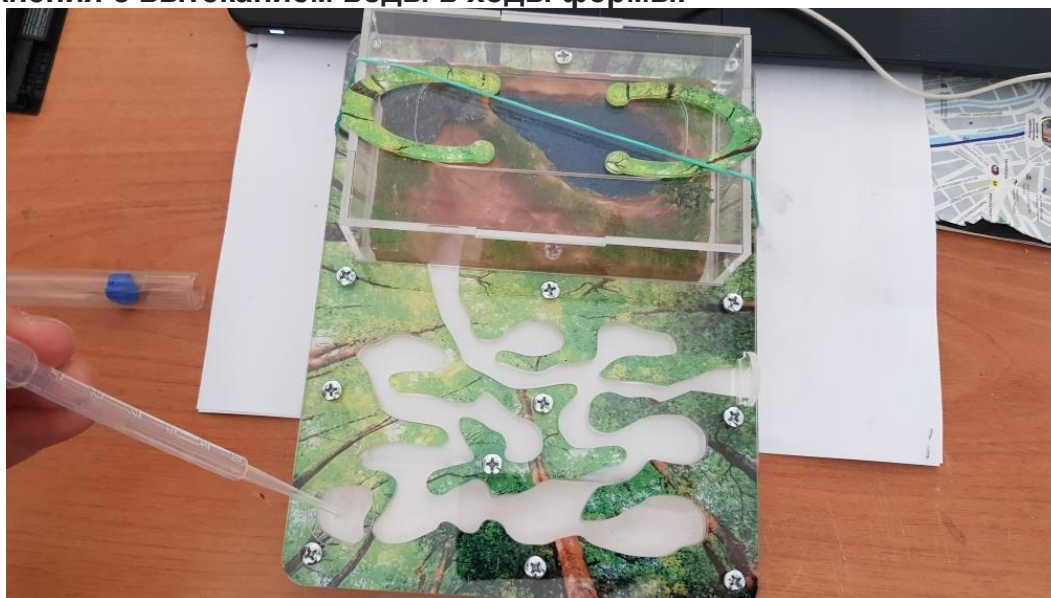
Фото 3 Увлажнение формикария

III Залить воду в камеру увлажнения при помощи пипетки идущей в комплекте (Если установлена заглушка с вырезом в виде капли), (Фото 3), Если вы увидели, что вода начала сочиться через стенки фермы, то в следующий раз необходимо заливать меньшее количество воды. Избегайте чрезмерного увлажнения с вытеканием воды в ходы фермы.